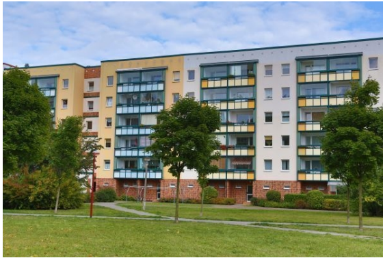
Ansicht des Objektes

Gerüstbauerring 9 in 18109 Rostock, Groß Klein